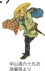
中山道六十九次 鴻巣宿より

各コース先着 20 名 参加費 500 円 申し込み・小諸市観光案内所 0267-22-0568