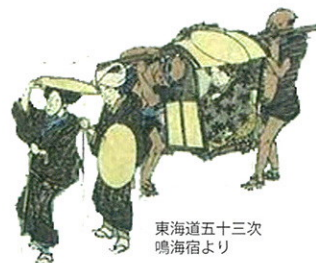
東海道五十三次 鳴海宿より