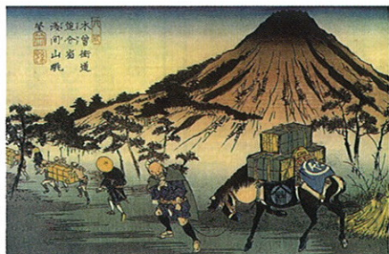
中山道六十九次 追分宿

しなの鉄道 平原駅集合(9時) 平原駅～平原宿～小諸宿～懐古園(10km) ウォーキングのみ 参加費 1000 円 蕎麦グルメ付きコース 参加費 2000 円 *三軒の蕎麦屋のはしご(各半盛り) 申し込み・小諸市観光協会 0267-22-1234