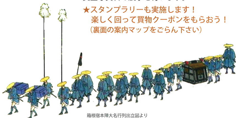
箱根宿本陣大名行列出立図より

★スタンプラリーも実施します！ 楽しく回って買物クーポンをもらおう！ (裏面の案内マップをごらん下さい)